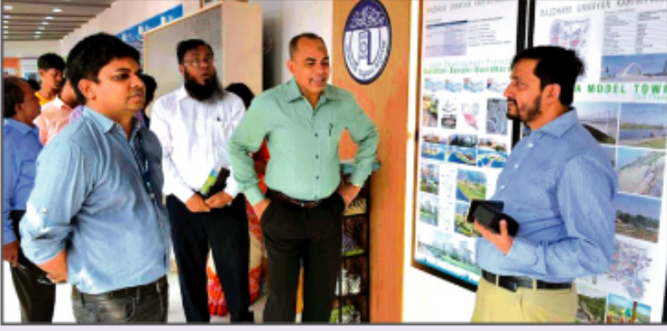
জাতীয় উন্নয়ন মেলা ২০১৮ তে রাজধানী উন্নয়ন কর্তৃপক্ষের প্রদর্শনী স্টল

জাতীয় উন্নয়ন মেলা ২০১৮-তে রাজধানী উন্নয়ন কর্তৃপক্ষ অংশগ্রহণ করেছে। প্রধানমন্ত্রী শেখ হাসিনা তাঁর সরকারি বাসভবন গণভবন থেকে ভিডিও কনফারেন্স এর মাধ্যমে দেশব্যাপী ০৪ অক্টোবর থেকে ৩ দিনের ‘উন্নয়ন মেলা-২০১৮’ এর উদ্বোধন করেন এবং এ উপলক্ষে আয়োজিত অনুষ্ঠানে বক্তব্য রাখেন। এবারের উন্নয়ন মেলা ২০১৮-এর প্রতিপাদ্য বিষয় ‘উন্নয়নের রোল মডেল, শেখ হাসিনার বাংলাদেশ’।