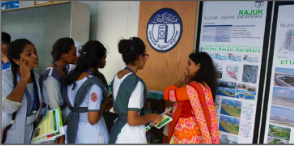
বিভিন্ন দর্শনাধীদেব রাজউকের প্রদর্শনী স্টল পরিদর্শন