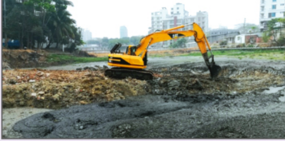
গুলশান-বনানী-বারিধার লেক উন্নয়ন প্রকল্পের শ্রাজ অপসারণ ও লেক পুন: খননের চিত্র

২) লেক পুন: খনন ৪ বনানী কবরস্থান হতে বনানী ১১ নং ব্রিজ পর্যন্ত ১.৪ কি.মি. লেক পুন: খনন এবং বনানী ১১ নং ব্রিজ হতে নিকেতন ব্রিজ পর্যন্ত ২.৪ কি.মি. লেক পুন: খনন কাজ সম্পন্ন হয়েছে।