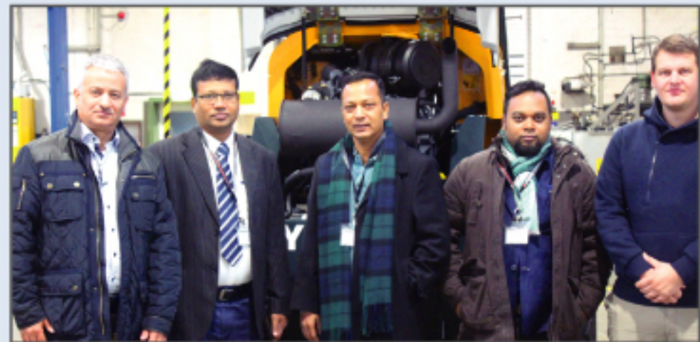
রাজউক এর কর্মকর্তাগণের জার্মানির ব্রেমেন শহরের ভারী মেশিনারী প্রস্তুতকারী প্রতিষ্ঠান 'এটলাস ওয়েসার' এর ফ্যাক্টরি পরিদর্শন