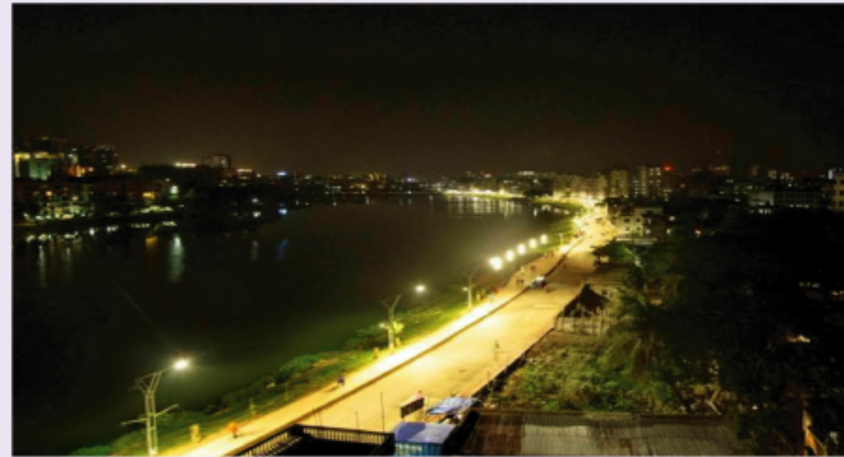
বাজডা (হাতিরঝিল মোড়) হতে শাহজাদপুর পর্যন্ত লেকের পাড়ে ২.৪০ কি.মি. লেক ড্রাইভ সড়ক

রাজধানীর গুলশান, বনানী ও বারিধারায় অবস্থিত লেক পরিবেশ অধিদপ্তর কর্তৃক ঘোষিত ‘পরিবেশগত সংকটাপন্ন এলাকা’। লেকটি অবৈধ দখলদারের কবল থেকে রক্ষা, লেকের পানি ধারণ ক্ষমতা বৃদ্ধি, পরিবেশ উন্নয়নের মাধ্যমে মহানগরীর নান্দনিকতা বৃদ্ধি, জনগণের চিন্তা বিনোদনের সুযোগ বৃদ্ধি ইত্যাদি লক্ষ্য নিয়ে রাজউক প্রস্তাবিত লেক উন্নয়ন প্রকল্পটি ৪১০.৫২ কোটি টাকা প্রাক্কলিত ব্যয়ে ২০১০ সালে একনেক কর্তৃক অনুমোদিত হয়। তদানুযায়ী প্রকল্পের মেয়াদ নির্ধারিত ছিল জুলাই/২০১০ হতে জুন/২০১৩ পর্যন্ত। যা পরবর্তীতে ব্যয় বৃদ্ধি ব্যতিরেকে জুন’২০১৯ পর্যন্ত মেয়াদ বৃদ্ধি করা হয়েছে।