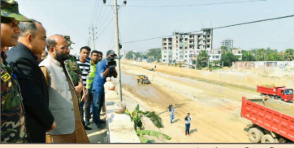
১০০ ফুট প্রশস্ত খাল খনন ও উন্নয়ন প্রকল্প পরিদর্শনে মাননীয় মন্ত্রী