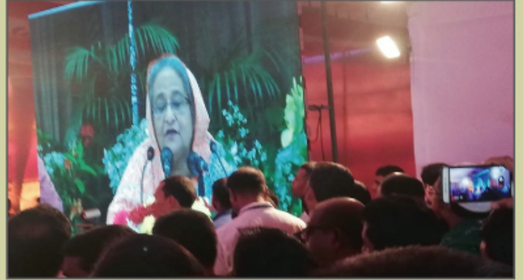
মাননীয় প্রধানমন্ত্রীর ভিডিও কনফারেন্সিং এর মাধ্যমে রাজউক উত্তরা এপার্টমেন্ট প্রকল্পের উদ্বোধন

গণপ্রজাতন্ত্রী বাংলাদেশ সরকারের মাননীয় প্রধানমন্ত্রী শেখ হাসিনা গত ০১ নভেম্বর, ২০১৮খ্রি. তারিখে রাজউক-এর উত্তরা এপার্টমেন্ট প্রকল্পের 'এ' ব্লকের বহুতল এপার্টমেন্ট ভবনসমূহ ভিডিও কনফারেন্সিং এর মাধ্যমে শুভ উদ্বোধন করেন। (আরও খবর ও এর পাতায়)