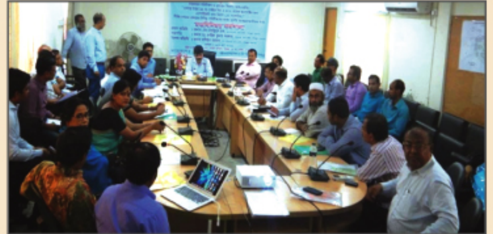
আইএমইডি মহাপরিচালকের সভায় প্রকল্পের কর্মকর্তাবৃন্দ